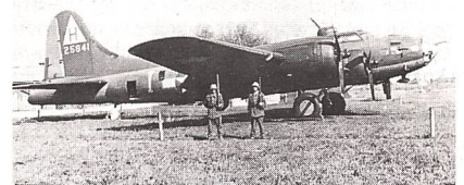
Amerikanische Boeing B-17 «Fliegende Festung» nach der Landung in Magadino.

Während des 2. Weltkrieges mussten 177 ameri- kanische Flugzeuge eine Notlandung ausführen oder stürzten ab. Es handelte sich dabei meis- tens um Bomber der Typen Boeing B-17 «Flie- gende Festung» und Consolidated B-24 «Libera- tor».