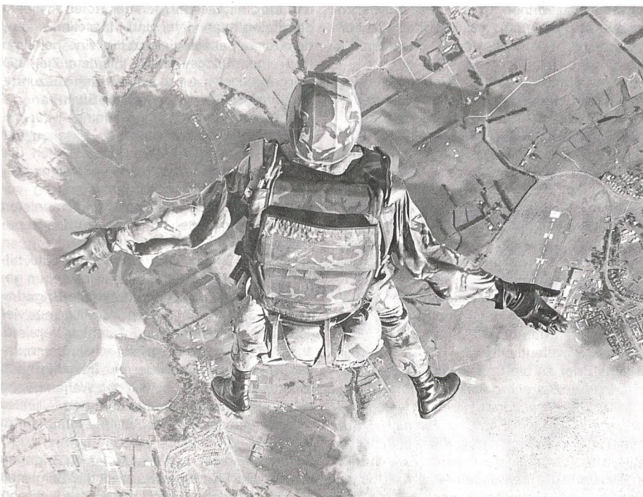
Angehöriger der Spezialeinheit «Special Air Service» beim Fallschirmabsprung; Quelle: Verteidigungsministerium Neuseelands.

Quelle: «The New Zealand Army» , Informationsblatt des Heeres