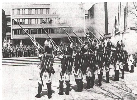
Nach dem geschäftlichen Teil der Versammlung demonstrierten die Beresina-Grenadiere ihr Können.