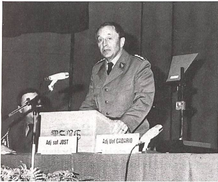
Korpskommandant Roger Mabillard, der Ausbildungschef der Schweizer Armee, spricht an der Delegiertenversammlung des SUOV in Glarus.

Regierungsrat Emil Fischli wies in seiner Grussadresse darauf hin, dass das ausserdienstliche Engagement heute einen besonderen Stellenwert habe, werde doch durch die Medien jede Gelegenheit benutzt, um die Armee in Misskredit zu bringen oder sie als Instrument der herrschenden Kreise darzustellen.