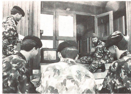
Video als Spiegel der eigenen Befehlsausgaben fördert die Selbstkritikfähigkeit und Einsicht (Motivation).

An Ort und Stelle wird der gesamten Geschützbedienung unmittelbar anschliessend der gesamte Stellungenbezug vorgeführt. Die Geschützequipe trägt brain-