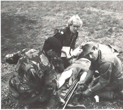
Mannschaft 12 beim Erste-Hilfe-Posten. 3 verschiedene Sprachen, niemand verstand den anderen, und doch musste man sich irgendwie verständigen.

zwar von jeder Nation ein Angehöriger der Armee. Weil aber einzelne Nationen stärker vertreten sind als andere Nationen, sind vielleicht in einem Team 2 Franzosen, 1 Kanadier, 1 Brite, 1 Österreicher, 1 Schweizer und 1 Deutscher. Es geht bei diesem Wettkampf nicht um Nationenstärke, sondern vielmehr um die Verständigung und Annäherung zwischen Soldaten verschiedener Nationen. Zusammenarbeit ist unbedingt notwendig, denn nur die Gesamtleistung einer Mannschaft kann den Sieg bringen.