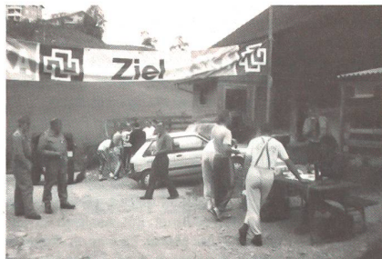
Am Ziel des Habsburger Patrouillenlaufes in Root.