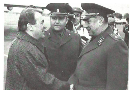
Verteidigungsminister Dr Robert Lichal (links) und sein sowjetischer Kollege Armeegeneral Dimitri Jasow (rechts im Bild).

Mit einer Viererserie erinnerte Kanada an den Zweiten Weltkrieg. Die 38-Cent-Werte geben (von links