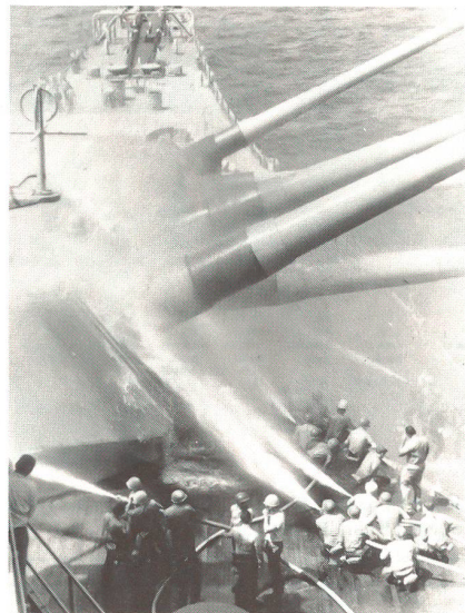
Das Bild zeigt Seeleute des Schlachtschiffes «USS Iowa» bei Löscharbeiten kurz nach der Explosion im Geschützturm B am 19.4.89 in der Karibik, bei welchem 47 Seeleute ums Leben gekommen waren.