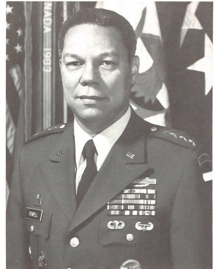
kommandierte das V. US-Korps in der Bundesrepublik Deutschland. Unmittelbar vor seiner Ernennung in das Amt des Chairman, das er nun vorerst für eine Dauer von zwei Jahren innehaben soll, war Powell Befehlshaber des Army Forces Command in den USA. JKL

Der Heeresgeneral Powell war unter Präsident Reagan oberster nationaler Sicherheitsberater. Der neue, erst 52jährige und jüngste Chairman – ausserdem der erste Schwarze im Amt des höchsten US-Militärs – hat 1962 und 1968 in Vietnam gedient, er war Adjutant von Verteidigungsminister Weinberger und