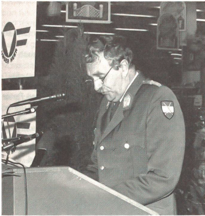
Armeekommandant General Hannes Philipp wird unter anderem wegen der angeblich unrichtigen Information an den Minister im Jahr 1990 kein besonders glücklicher Soldat werden.

de Zeit kompensieren will, hat er nicht erklärt. Er dürfte sie auch nicht erklären wollen, denn 1990 ist ein Wahljahr, und hier sollen Belastungen der Bevölkerung vermieden werden. Damit im Zusammenhang dürfte auch die Verkürzung der Arbeitszeit für das Kaderpersonal stehen. Die den allgemeinen Beamten dienstrechtlich angepassten Berufsoffiziere und beamteten Unteroffiziere (rechtlich gesehen gibt es keine Berufsunteroffiziere in Österreich) hätten derzeit 41 Stunden pro Woche zu arbeiten.