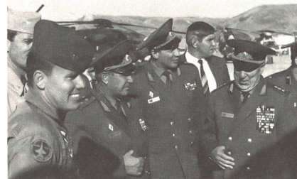
Auf dem Stützpunkt des Marinecorps von Camp Pendleton in Kalifornien wurde der sowjetischen Militärdelegation mit Verteidigungsminister Yasow (rechts) Kriegsmaterial vorgeführt. Hier ist Yasow im Gespräch mit einem F/A-18-Piloten des Marinecorps.

Anfangs Oktober 1989 traf der sowjetische Verteidigungsminister, Dimitri Yasow, zu einem einwöchigen Besuch in den USA ein. Nach den vorangegangenen Kontakten zwischen den USA und der UdSSR war dies ein weiterer Höhepunkt, weil es der erste Besuch eines Verteidigungsministers in den USA war. Im Verlauf des Sommers war der Vorsitzende der Vereinten Stabschefs der US Streitkräfte in der Sowjetunion