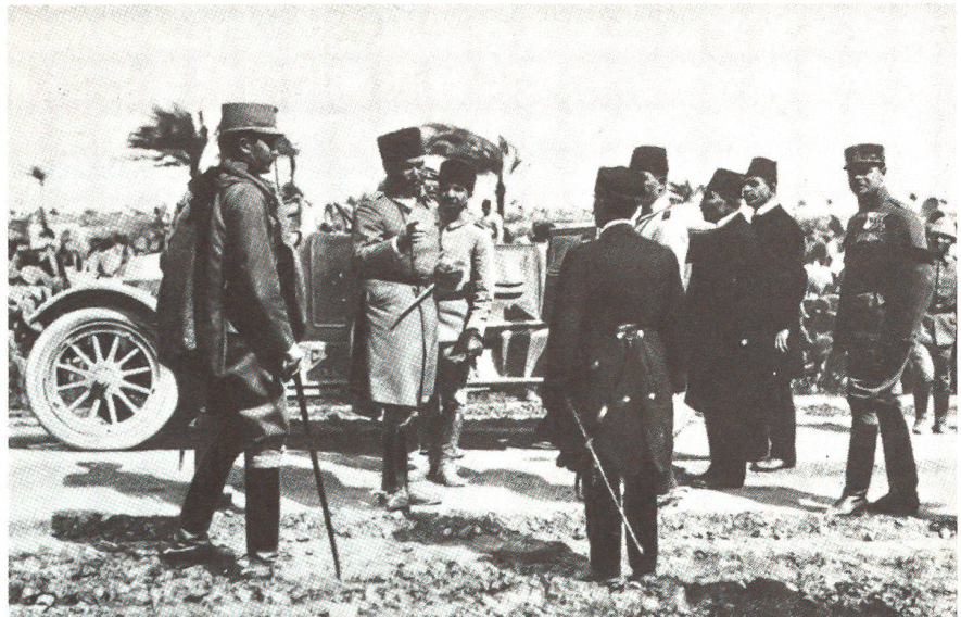
General Liman von Sanders, der deutsche Oberbefehlshaber der 13 türkischen Divisionen auf der Gallipoli-Halbinsel im Gespräch mit türkischen Offizieren. Mustafa Kemal kommandierte damals 33jährig eine der Divisionen. Bild aus dem Buch «Grosse Landschlachten» .

Am 12. November 1914 tritt die Türkei an der Seite der Mittelmächte in den Ersten Weltkrieg ein. Mustafa Kemal drängt zur Front und wird 1915 mit der Aufstellung der 19. Division in Teikirdag beauftragt. Als Divisionskommandeur auf der Halbinsel Gallipoli eingesetzt, wehrt er durch taktische Klugheit und persönliche Tapferkeit die Angriffe der Briten bei Ariburnu und Anafarta erfolgreich ab und erringt sich hohes Ansehen bei dem deutschen Armeeeoberbefehlshaber General von Sanders. Dieser schlägt ihn dann auch zu seinem Nachfolger vor.