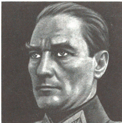
Mustafa Kemal Atatürk (1881–1938), Gründer der modernen Türkei und Staatspräsident seines Landes bis zu seinem Todestag am 10. November 1938

Der junge Sprössling wird auf einer Koranschule eingeschult und wechselt nach einem halben Jahr in eine weltliche Schule über. Der Vater hat sich also mit seinen Vorstellungen durchgesetzt und wahrscheinlich damit den entscheidenden Grundstein für die weitere Entwicklung des jungen Mustafa gelegt. Während nämlich die strengen konservativen und religiösen Türken nichts oder nur wenig im türkischen Alltag oder an der türkischen Verhaltensweise ändern wollten, standen auf der anderen Seite allem Neuen aufgeschlos-