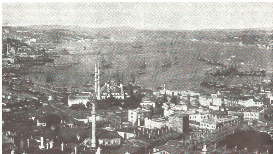
Der Hafen von Konstantinopel und der Bosphorus um 1915.

Diese Gesamtentwicklung im Land ruft die nach Unabhängigkeit strebenden Araber und Christen, aber auch die Türken selbst auf den Plan. In Frontstellung zur religiös-konservati-