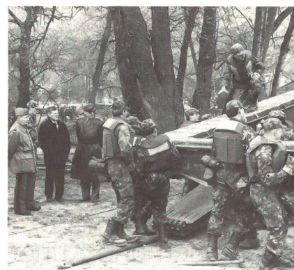
Beim Bau der «Festen Brücke 69» über das Strängli.