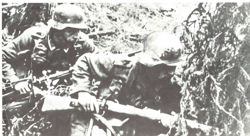
Spähtrupp im Wald – nicht getarnt

Jetzt galt es! Auf einen Wink des Spähtruppführers sprangen seine zwei Begleiter mit den Waffen im Anschlag links und rechts an die Haustüre heran. Der Unteroffizier erhob deutlich sichtbar seine MPI, der etwas entfernte Sicherungstrupp gab wie verabredet einige Schüsse ab. Fast unmittelbar darauf flog wie erwartet die Tür auf, in ihrem Rahmen stand, die MPI unterm Arm, ein sowjetischer Hauptmann. Er erkannte sofort, was wirklich los war und schoss noch einen Moment früher als der Unteroffizier. Da er jedoch aus der Hüfte feuerte, war seine Garbe ungezielt und ging um Haaresbreite vorbei. Der Unteroffizier, dessen Schusserie Sekunden später fiel, traf tödlich. Noch über den Toten hinweg stürzten zwei Leutnants mit schussbereiten Waffen aus der aufgerissenen Türe. Nun war nicht mehr daran zu denken, sie gefangen zu nehmen und im Feuer der drei Spähtruppmitglieder brachen sie ebenfalls zusammen. Der Unteroffizier rannte noch in das Haus, raffte dort herumliegende