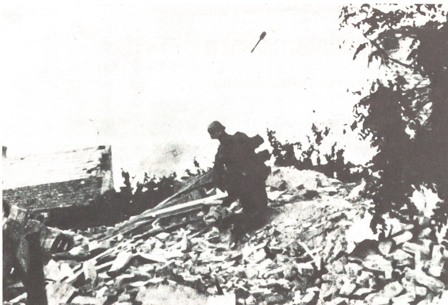
Handgranatenwurf gegen feindliches Widerstandsnest

Papiere zusammen, und dann wurde es auch schon höchste Zeit zu verschwinden, denn der vorgekommene Feuerwechsel hatte sicher im weiten Dorf noch vorhandenen Feind alarmiert. So hetzten die drei Männer im Laufschrift zum Sicherungstrupp zurück, um dann zusammen unverzüglich wieder im Wald unterzutauchen. Feindliche Soldaten waren zwar am Ortseingang erschienen und hatten das Feuer eröffnet, nahmen aber keine Verfolgung auf, wohl weil sie zu überrascht und auch ihre Offiziere gefallen waren.