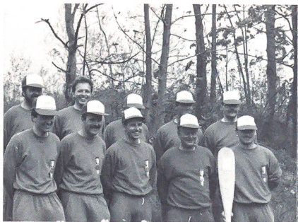
Die Bootsbesatzung des UOV Reiat siegte ...