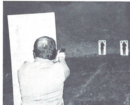
... stehend ...