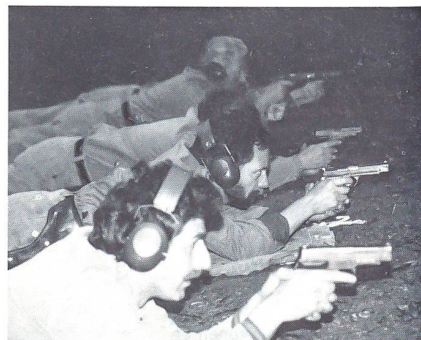
... und liegend.