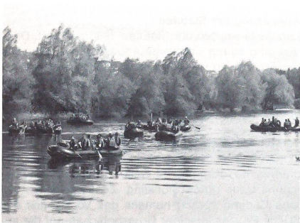
... an der 15. Reusstafahrt des UOV Emmenbrücke.