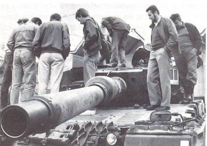
Aus der Nähe bestaunten die Mitglieder des UOV Büren den Leopard II, den neuesten Panzer der Schweizer Armee.

Vergleichsweise leise zeigte sich der neueste Panzer der Schweizer Armee, der Leopard II, auf der Thuner