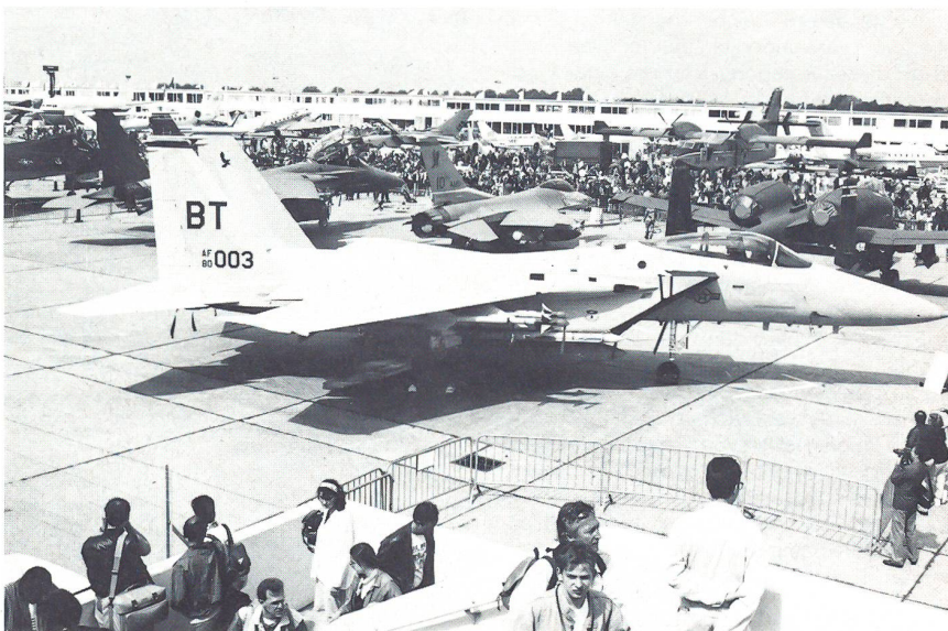
Dessert Storm in Paris, die USA stellten dieses Jahr alle Flugzeugtypen der am Golf eingesetzten Maschinen dem breiten Publikum zur Show. Im Vordergrund eine F-15, dahinter eine F-16 und eine A-10.

Das grösste Interesse des breiten Publikums zog der amerikanische Stealth Fighter F-117 der US Air Force auf sich. Allein die kantige Form und die pechschwarze Bemalung stachen zwischen den sonst üblichen himmelblauen und sandfarbenen Militärflugzeugen hervor. Die USA brachten nicht nur die gesamte Palette der im Golfkrieg eingesetzten Flugzeuge mit nach Paris, es wurde natürlich auch eine komplette Patriot-Einheit vorgeführt. Die Bedienungs- und Bewachungs-