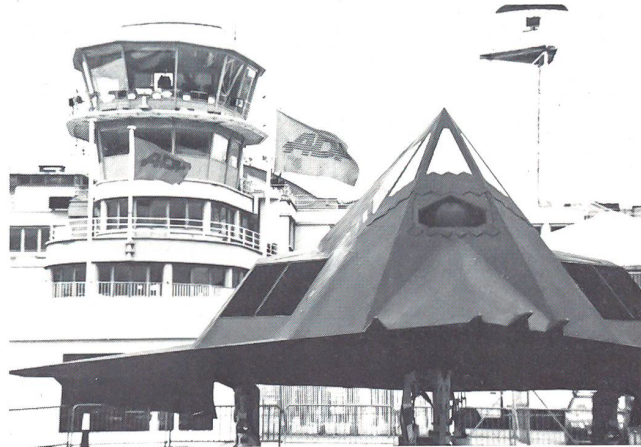
Das wohl auffälligste aller Flugzeuge am diesjährigen Salon – der amerikanische Tarnkappenbomber F 117 Stealth Fighter.