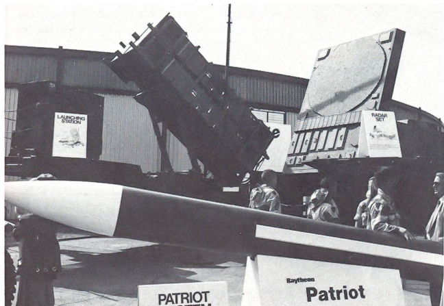
Die Helden von Israel – eine komplette Patriot-Stellung mit Werfer- und Radarstellung wurde ausgestellt.

schon bei der MiG-29 und der SU-27 vor zwei Jahren zu sehen, geradezu krass auf. Hingegen bei der zivilen Luftfahrt der UdSSR sieht man eine deutliche Verbesserung von Verarbeitung und Qualitätsstandard. So hofft man bei Ilyushin, dass ihre Langstreckenjets Il-96-300 und die Il-86 bald mit westlichen Triebwerken des Typs CFM-56 ausgerüstet auch ausserhalb der UdSSR Abnehmer für ihre Flugzeuge finden werden. Die Beriev A-40 Albatros, das einzige mit Jet-Antrieb versehene Flugboot der Welt, suchte sich in Le Bourget genauso einen westlichen Abnehmer wie die zivile Version des U-Boot-Jagdhubschraubers Kamov KA-32 Hormone. In vielen Bereichen suchen die sowjetischen Hersteller den Kontakt zur Zusammenarbeit mit westeuropäischen und amerikanischen Firmen.