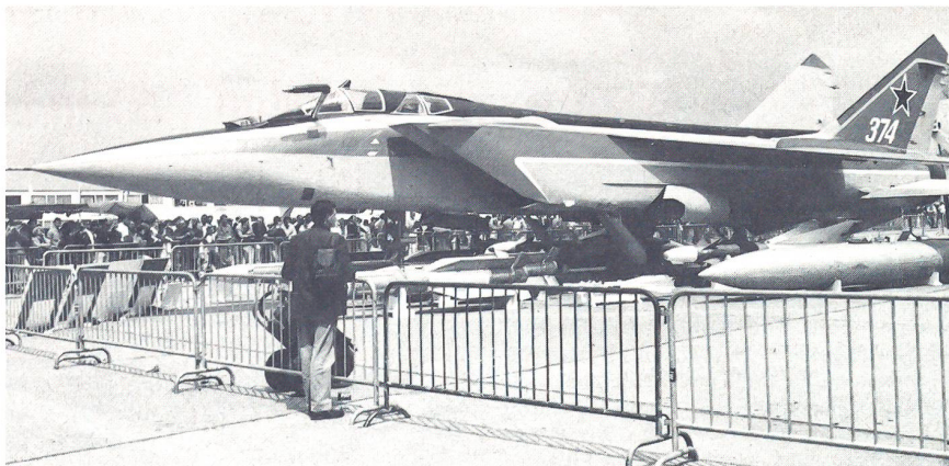
Der erstmals im Westen vorgeführte sowjetische Überschallabfangjäger Mikoyan MiG 31.

Aber nicht nur die immensen Kosten einer solchen Ausstellung tragen dazu bei, dass solches Gedankengut bei Ausstellern in den Köpfen der Verantwortlichen herumschwirrt, es ist sicherlich auch bei der Organisation des Salons zu suchen. So mussten nicht nur die gewöhnlichen Besucher als erstes etwa dreiviertel Stunden vor den verstopften Eingängen warten, nein, selbst den Ausstellern gelang nur selten ein schneller Eintritt ins Areal. Es wäre schön, wenn die Veranstalter aus solchen Fehlern lernen könnten und nicht alle Jahre wieder die gleichen Hindernisse Besuchern und Ausstellern in den Weg legen würden. Es ist zu hoffen, dass in zwei Jahren, wenn der 40. Salon durchgeführt wird, auch