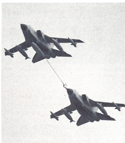
Zwei italienische Tornados zeigten eine Luft-Luft-Betankung im Tiefflug.

noch grosse Firmen anzutreffen sind. Von Verkaufsständen mit Fliegersouvenirs alleine ist die Ausstellung keinen Besuch mehr wert.