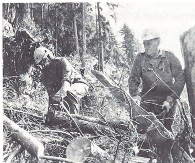
Zivilschutzpflichtige verrichten Aufräumarbeiten in den Schadengebieten

Mit Genugtuung darf das Amt für Zivilschutz des Kantons Bern feststellen, dass diese Grossak-