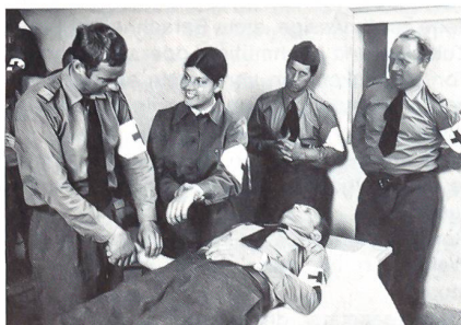
Eine Angehörige des RKD im Einsatz

Einen Gesamtüberblick über Sicherheitspolitik und Gesamtverteidigung bietet die Broschüre « Auch Friede braucht Schutz ». Vier GV-Bereiche stellen sich und insbesondere Mitwirkungsmöglichkeiten für Frauen in dieser Mappe vor.