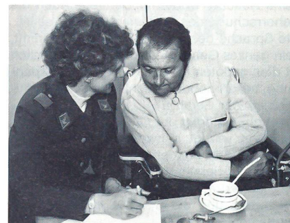
Spitalbetreuer MFD im Gespräch mit einem Patienten

So schafft man frohes Wesen in der Truppe, festen Kitt, Vertrauen in die Vorgesetzten, so bekämpft man Nörgelei und Missmut, so hebt man die Gesinnung und befähigt die Truppe zum höchsten Opfer in der Stunde der Not.