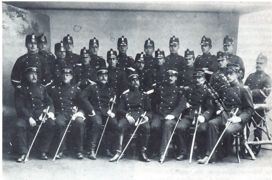
Ob diese Rekruten wohl noch von den fortschrittlichen Gedanken zur Ausbildung profitiert haben?

Wer seine Truppen erziehen will, muss sie lieben und ehren.