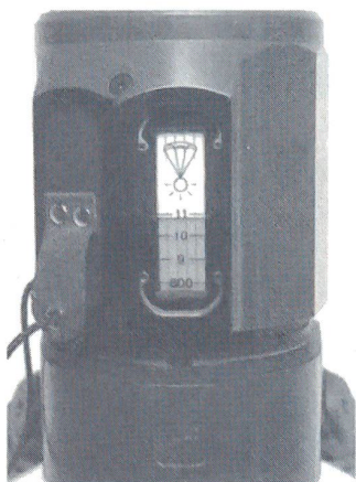
Visierskala für Beleuchtungsgranaten