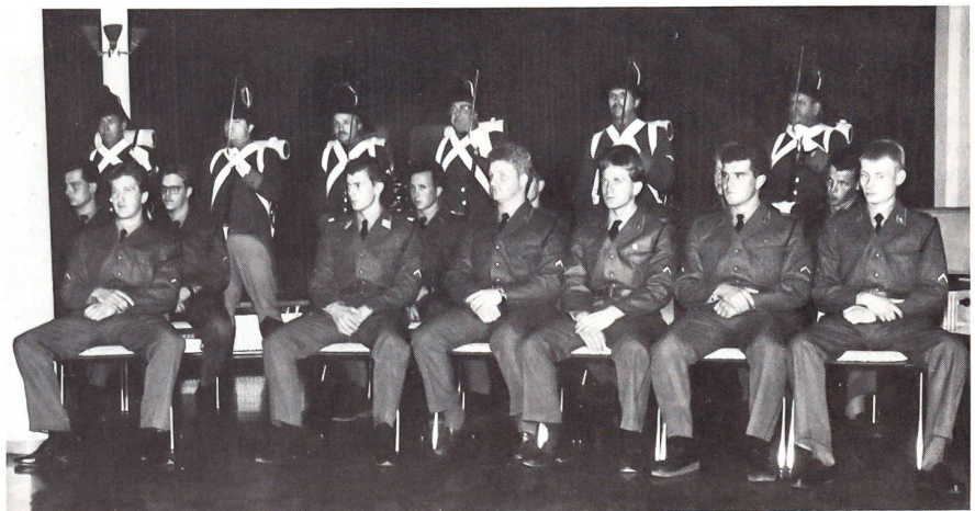
Ein Teil der neu ernannten Korporale, flankiert von den Freiburger Grenadiere in ihren alten, schmucken Uniformen