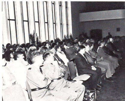
Gäste bei der Brevetierungsfeier