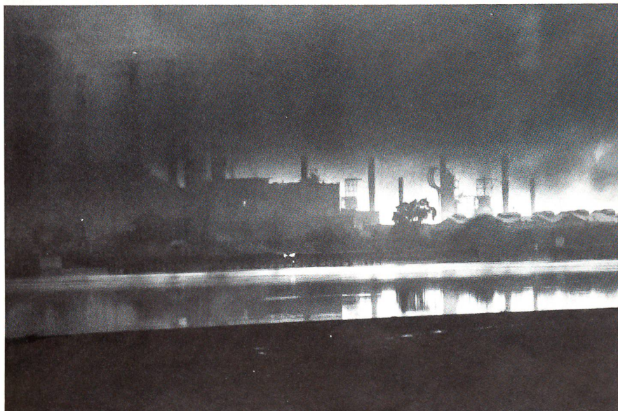
Die Erdölraffinerien von Abadan in Flammen.

Im Mittelabschnitt wurden die irakischen Truppen bei Ahwaz hinter den Karun-Fluss zurückgeworfen; im Südabschnitt verloren die Iraker nach heftigen Kämpfen und hohen Verlusten für den Angreifer die Stadt Khorramschahr. Bis Ende September hatten die irakischen Truppen weitere Bodengewinne unter dem anhaltenden Druck aufgeben müssen. Dann erstarrte die Front erneut; örtlich