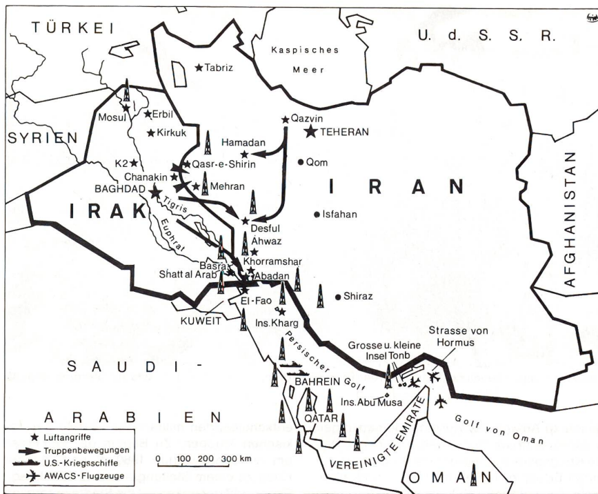
Aus Weltanschauung 80

und endete im August 1988. In diesem Zeitraum durchlief der Krieg mehrere Phasen, in denen das Kriegsglück abwechselnd einer Macht zuzuneigen schien. Im einzelnen lassen sich vier zeitliche Abschnitte unterscheiden – und zwar: