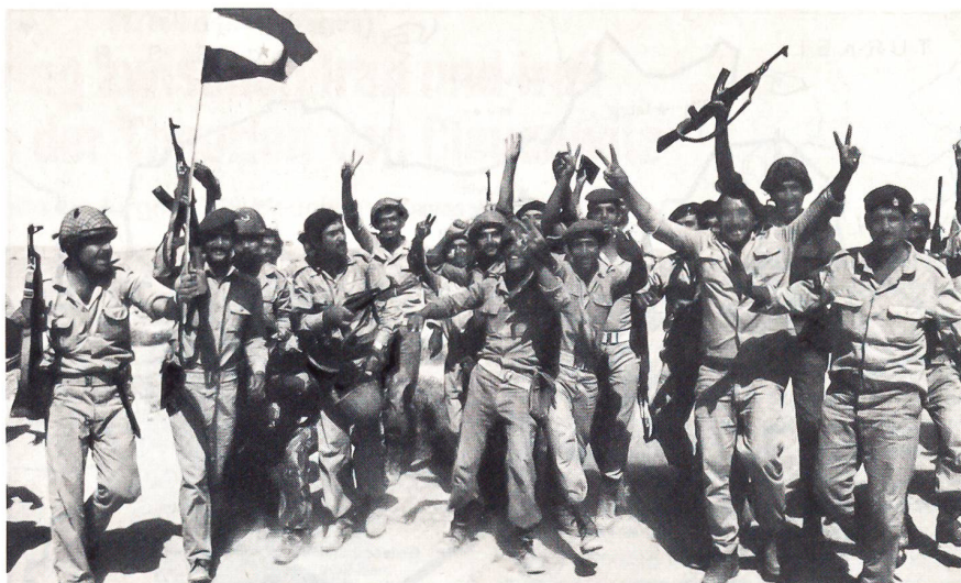
Irakische Truppen ziehen siegesgewiss in den Krieg gegen Iran.

Doch all diesen Bemühungen blieb ein Erfolg versagt, was wohl vor allem darauf zurückzuführen ist, dass diese Bemühungen eben