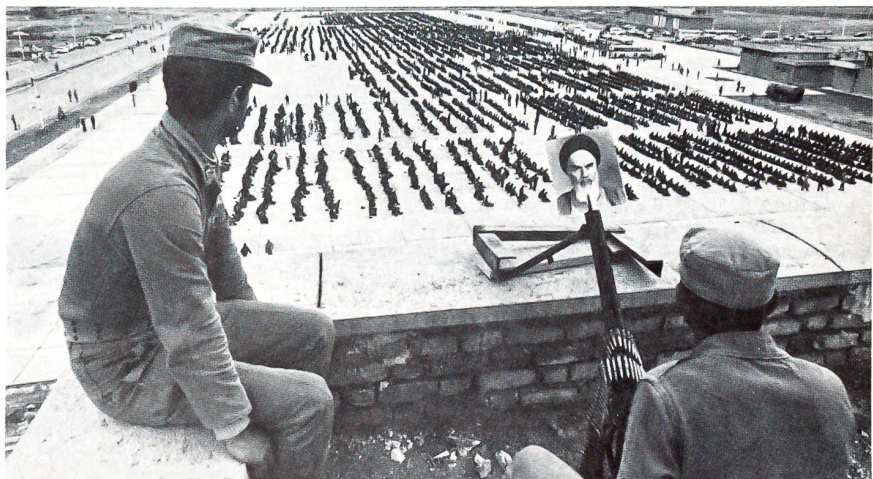
Tausende von Irakern werden bei den 1982 vorgetragenen Offensiven Irans gefangengenommen.

Der Krieg am Golf begann im September 1980