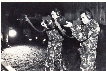
...und das Sturmgewehr-Schiessen ist nicht einfach in der dunklen Nacht.