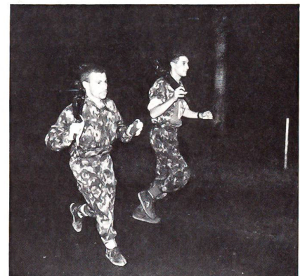
Das Auffinden der Posten...

Von den 72 gemeldeten Patrouillen sind nur deren 60 angetreten und klassiert worden. Wenn es der gegen Abend einsetzende Regen gewesen sein sollte, der die anderen von der Teilnahme abgehalten hat, müssen sie wissen, dass der Boden eigentlich nicht allzu schwer war und sie einen schönen, fairen und wiederum bestens organisierten Lauf verpasst haben. Die Teilnehmer auf alle Fälle waren des Lobes voll über die Organisatoren. Andererseits zeigten sich auch die zivilen und militärischen Gäste, deren Betreuung die UOG immer ein spezielles Augenmerk widmet,