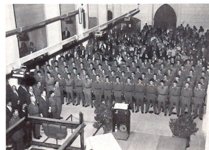
Die altehrwürdige Klosterkirche war bis auf den letzten Platz besetzt.

An der vom Spiel der Aarauer Inf RS 205 musikalisch umrahmten Beförderungsfest vernahm man von Schulkommandant Oberst i GSt Stutz, dass 46 Prozent der 55 aus 17 Kantonen kommenden Absolventen der Uem OS Studenten oder Akademiker sind. Einen besonderen Status hat die Ftg OS, deren 20 Absolventen ein Durchschnittsalter von 31 Jahren