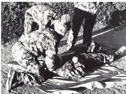
Mit einfachen Transportgriffen können selbst schwergewichtige Kameraden in die nächste Dekung gezogen werden.

Am Posten Kameradenhilfe schliesslich wurden den Übungsteilnehmern die wichtigsten lebensrettenden