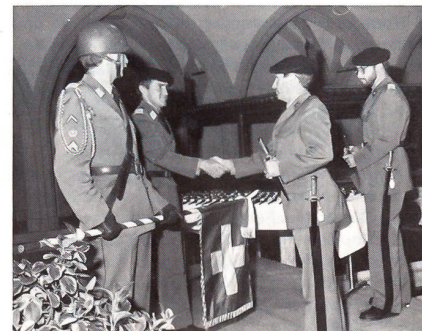
55 neue «Bülacher» Übermittlungs- und 20 neue Feldtelegrafisten-Offiziere wurden in der Klosterkirche Königsfelden im aargauischen Windsch brevetiert.