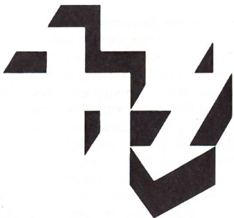
ABB ASEA BROWN BOVERI