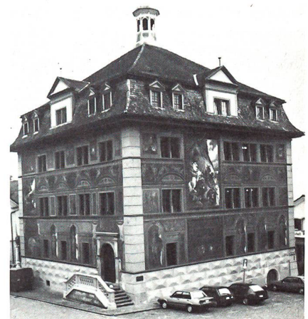
Die Medientagung fand im Rathaus zu Schwyz statt

Sowohl das G Bat 9 als auch die Gt Kp V/9 und die G Abt 64 verfügen über alle notwendigen Baumaschinen und Hilfsmittel, um technisch anspruchsvolle Bauaufgaben effizient ausführen zu können. Parallel zur Übung «EXCALIBUR» werden die Genietruppen für folgende Aufgaben eingesetzt: