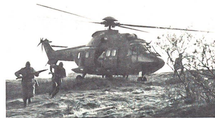
Markeure im Einsatz mit Super Puma am Morgarten

Nach den Stäben rückten am Montagmorgen die übrigen Wehrmänner der Reduit-Brigade 24 ein. Die Mobilmachung der Brigade wurde durch Sabotageakte von Markeuren des Gebirgs-Infanterieregimentes 18 aus der Gebirgsdivision 9 überprüft und gestört. Saboteure, die zum Teil als Zivilisten verkleidet waren, überprüften die einrückende Truppe auf Wissensstand und Geheimhaltung. Durch Desinformation, Eindringen in Lokalitäten, Einschleusen falscher Büroordnungen oder als Zeughausangestellte verkleidete Wehrmänner wurde versucht, die Mobilmachung zu stören. Zu Beginn verliefen die Aktionen erfolgreich. Beispielsweise konnten Markeure auf verschiedene Organisationsplätze eindringen und mobilisierende Truppenteile entführen. Auf einem Korpsmammelplatz wurden Wehrmänner unbemerkt fehlgeleitet. Die Aufmerksamkeit der Beübten nahm im Verlaufe der Übung zu, die Sicherungen