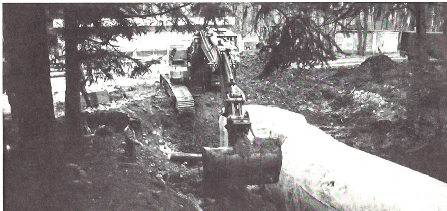
FU 88 wird eingedeckt