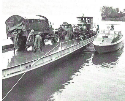
Übersetzen der Sch Kan Btr II/58

Nicht schlecht staunten Passanten, die sich zufälligerweise am Ufer des Urnersees befanden: Sie wurden Zeuge, wie die verstärkte schwere Kanonenbatterie II/58, bestehend aus drei Kanonen samt Lastwagen, 67 Wehrmännern, Munition und Versorgungsmaterial mittels zweier Lastschiffe von Brunnen nach Flüelen transportiert wurde. In der Tat – die Übung «Lago Quattro» erregte Aufsehen. Weil vor ein paar Jahren das militärische Lastschiff-Detachement in Kompaniestärke