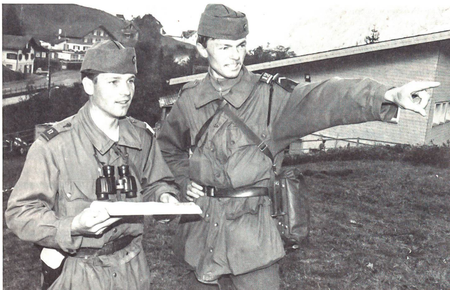
Zugführer mit Korporal als Bauchef bei der Vorberechnung zum Einbau des Feldunterstandes 88 (FU 88)

Seit dem frühen Dienstagmorgen steht die Truppenübung in der Phase «EXCALIBUR DUE». Die Dienstleistenden haben neue Aufträge erhalten: Innert nützlicher Frist müssen Stellungen bezogen und ausgebaut sowie Gegenstösse und -angriffe eingeübt werden. Dabei kommt den verschiedenen Absprachen zwischen den ortsfesten und mobilen Truppen grosse Bedeutung zu. Der Bezug dieses Abwehrdispositivs wird wiederum durch Markeureinsätze gestört. Dazu werden die Berner Wehrmänner des Gebirgsschützen-Bataillons 3 durch die Übungsleitung eingesetzt.