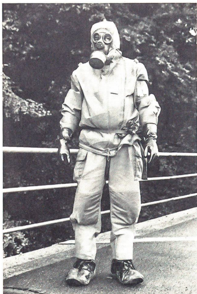
Mineur im Schutzanzug CESAR 88.

Julius Cäsar, der grösste Feldherr der antiken Römer, eroberte nicht nur die ganze Mittelmeerregion bis nach Afrika, sondern unterwarf auch die wackeren Helvetier bei Bibracte. Ein Nachfahre des Juliers ist nun, fast zweitausend Jahre später, daran, die Schweizer Armee zu infiltrieren. CESAR heisst der Junge, und er tritt auf in Form dieses neuen Ganzkörperschutzes. Seit zwei Jahren werden Truppen, deren Gefährdung durch chemische Kampfstoffe besonders gross ist (wie Flieger-, Fliegerabwehrtruppen und Mineure) mit dem CESAR (C-Schutz-Anzug Rapid) ausgerüstet. Er schränkt zwar die Bewegungsfreiheit des einzelnen ein, verbessert aber den Schutz gegen sesshafte chemische Kampfstoffe – von denen es noch immer grosse Arsenale gibt auf der ganzen Welt – derart, dass der Wehrmann trotz Verseuchung des Gebietes weiterarbeiten kann.