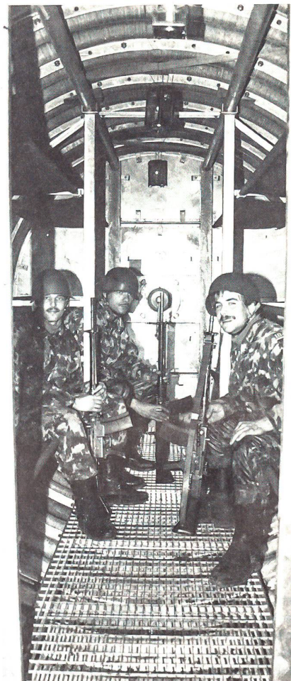
Drei Wehrmänner im neuen Feldunterstand 88 in Sicherheit. Es handelt sich um den vorfabrizierten Schutzbau von Dr Ing Koenig AG, Abt Schutzbauten