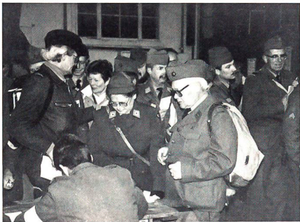
... und am Ziel zur Abgabe der Auszeichnung.

usw behördliches Startverbot, so dass «nur» 5460 nach Thun marschieren durften.