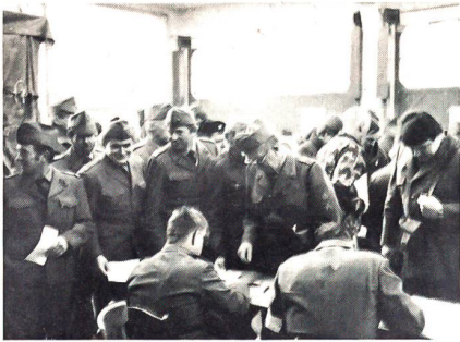
«Man» drängt sich zum Start...