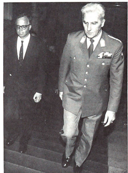
Neuer Bundesminister für Landesverteidigung Dr Werner Fasslabend (links im Bild) und General Karl Majcen.

Bei seinem Amtsantritt erklärte der neue Minister: «Ich trete allen, unabhängig von Funktion und Dienstgrad, offen und unvoreingenommen entgegen. Was für mich zählt, ist Leistung und Charakter.» Als Primäraufgabe seiner Ressortführung nannte er «die Verteidigungsdoktrin den neuen Bedrohungen anzupassen», denn die politisch-militärische Situation in Europa ist wesentlich labiler geworden. Weiters wolle er Ausbildung, Ausrüstung und Motivation der Truppe sowie die Erhöhung des Friedensnutzens des Bundesheeres und dessen Akzeptanz in der Gesellschaft erreichen. «Das Heer wird in zehn Jahren anders aussehen», verspricht er. Die Grundwehrdies-