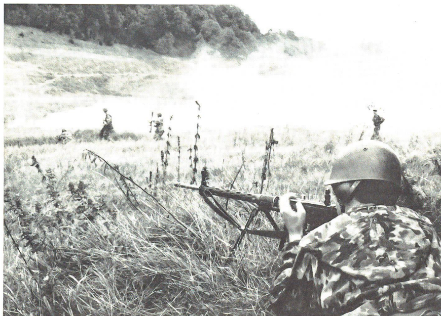
Vorstoss im Schutze des Nebels, die Wucht der HG reiss eine Bresche ins Hindernis, Uestü Trp im Einsatz