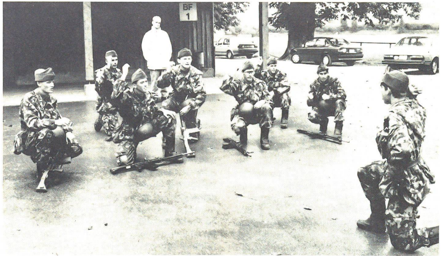
Die Gruppe Lindemann beim drillmässigen Einüben der Gefechtszeichen

Im Gefechtsdrill, neu auch Gefechtsexerzieren oder Gefechtstraining genannt, werden Gefechtsformationen eingeübt. Der Unteroffizier nimmt in diesem Ausbildungsbereich eine Doppelfunktion ein, nämlich er ist Übungsleiter und taktischer Kommandant zugleich. Mindestens 6 Gefechtsformen und rund ein Dutzend Gefechtszeichen sollte eine