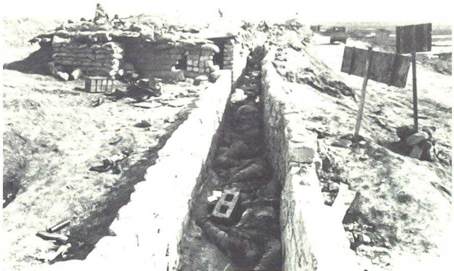
Massengrab der Feinde in den eroberten Stellungen. Bis zum Frühjahr 1988 fielen dem Krieg gegen 900 000 Menschen zum Opfer. Aus Weltrundschau 87

Der Krieg des Irak gegen den Iran entsprang dem Unvermögen beider Staaten, die anstehenden Probleme politischer Art durch andere denn militärische Mittel zu lösen. Die