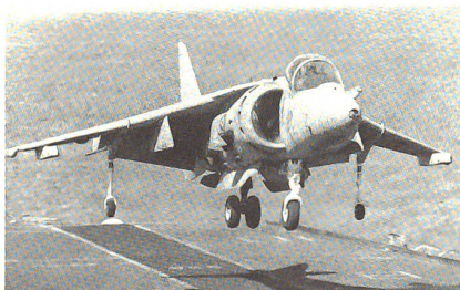
AV-8B: die Weiterentwicklung des altbekannten Senkrechtstarters HARRIER dient den MARINES in erster Linie in der Erdkampffrolle.

In den Golf verlegt worden sind aber auch fliegende Einheiten der US Marines (Marine-Infanterie). Mindestens zwei Staffeln F/A-18 HORNET (um die 50 Maschinen) operieren von Basen in Bahrain aus. Von Landungsschiffen und von Saudiarabien aus fliegen Senkrechtstarter des Typs AV-8B HARRIER Einsätze gegen irakische Ziele vornehmlich in Kuwait. Als Zielzuweiser für die MARINES sind die zweiseitigen Propellermaschinen OV-10 BRONCO und Jets des Typs OA-4M – eine stark modifizierte Version des veralteten Jagdbombers A-4 SKYHAWK – aktiv. Mit Abzug der französischen Flugzeugträger ist im Golf die SUPER ETENDARD nicht mehr aktiv. Das Angriffsflugzeug kann mit einer Vielzahl von Waffen zur Bekämpfung von Schiffen und Erdzielen ausgerüstet werden – darunter auch der aus dem Krieg um die Falklands berühmt-berüchtigten Anti-Schiff-Lenkwanne EXOCET.