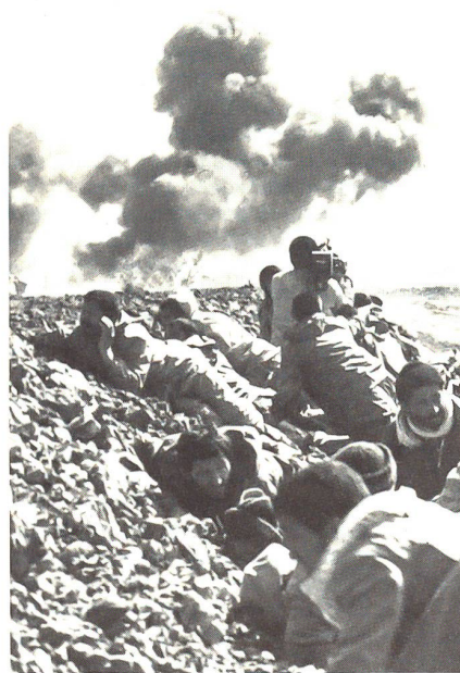
Phasenweise setzten die Iraker verheerend wirkende Giftgase ein. Aus Weltrundschau 86

«... der kriegerische Akt eines Feldzuges nicht in kontinuierlicher Bewegung fortläuft, sondern ruckweise, und dass also zwischen den einzelnen blutigen Handlungen eine Zeit der Beobachtung eintritt...» 116)