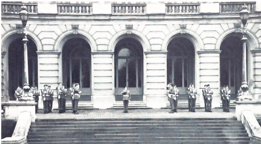
Wachablösung beim Palast in Brüssel