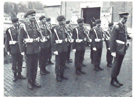
Neue Wache zur Inspektion bereit

offizier und einem Offizier. Beim Palast in Brüssel sind vier Posten zu besetzen, beim Schloss in Lake nur zwei.