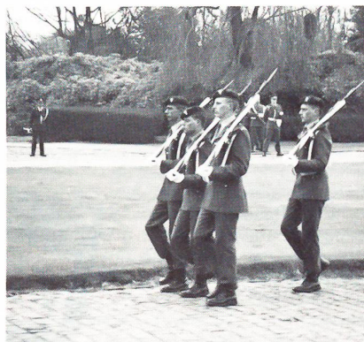
Wachablösung in Lake

Das kleine Detachement besteht aus sechs Grenadiern, einem Gefreiten, einem Unter-