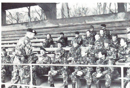
Eifrige Diskussionen über den Ausbildungsschwerpunkt «Wehrmotivation» gab es auf der Tribüne Schachen.

reiten und abzuschliessen, ein effizientes Arbeitsprogramm zu erstellen, und sie kennen die Möglichkeiten der Ausbildung im Rahmen des Ausbildungsschwerpunktes 1991. Die Inspektoren wurden angeleitet, eine Kaderübung objektiv zu beurteilen und nach einem festgelegten Schema eine Übung zu analysieren und allenfalls zu kritisieren.