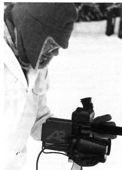
Trotz Temperaturen von minus 25 Grad Celsius stand das Video-Team täglich im Einsatz.