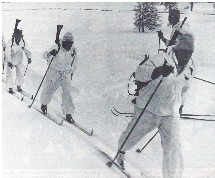
Auf dem Trainings-Rundkurs.