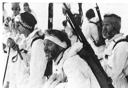
Kritische Augen verfolgen die Arbeit einer Klasse.