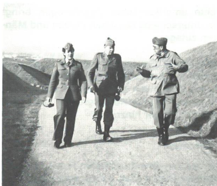
Unterwegs am Instr Pistkurs im Dezember 1990 mit Brigadier Eugénie Pollak Iselin und Oberst i Gst Chouet

– Vorrekognoszierung von Schulstandorten in der welschen Schweiz.