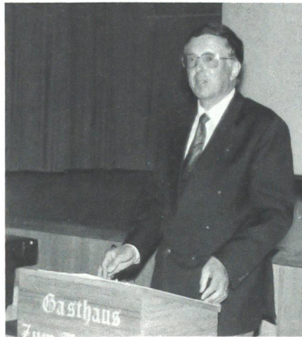
Divisionär Hansruedi Ostertag vermittelte Führungsthese aus der Praxis

Erfolge resultieren nicht nur aus der optimalsten Nutzung unserer Führungsmittel, die uns mit modernen Geräten, leistungsfähigen Systemen und einer zweckmässigen Infrastruk-