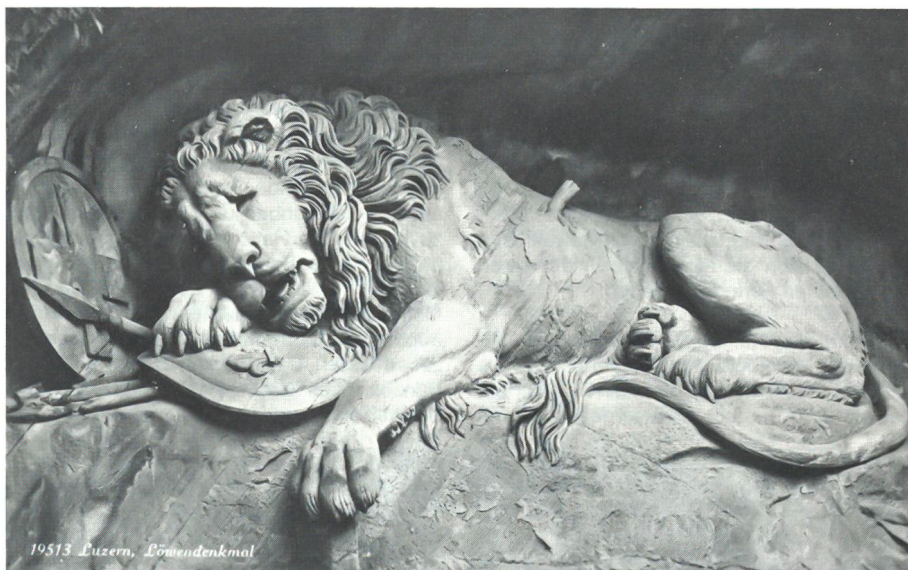
Löwendenkmal in Luzern, eingeweiht am 10. August 1821 (Ansichtskarte um 1920).

Wenn rechtlose Arbeiter überall im König-