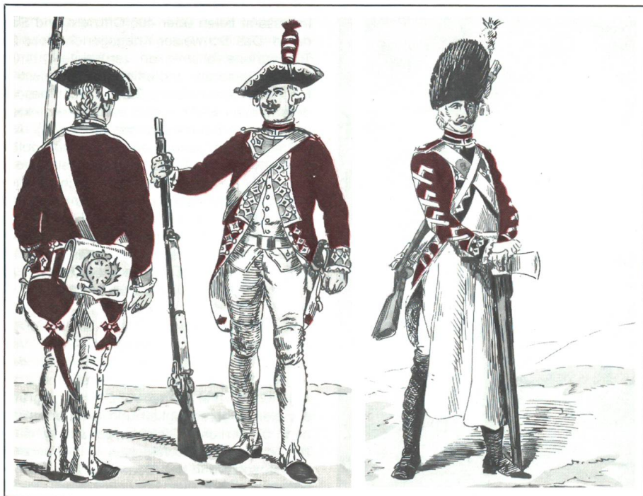
Füsilier (links) und Kanonier (Mitte) sowie rechts Sappeur des Schweizer Garderegiments (Ansichtskarten um 1920).

Vielleicht wäre es unmittelbar nach der wenig glorreichen Einnahme des praktisch leeren Staatsgefängnisses (später zum Nationalfeiertag erhoben), das von einer Invalidenkompanie sowie 32 Füsiliern, einem Wachtmeister und einem Leutnant aus dem Schweizer Regiment Salis-Samaden verteidigt worden war, noch gelungen, die Lage unter geballtem Einsatz der halbwegs loyalen