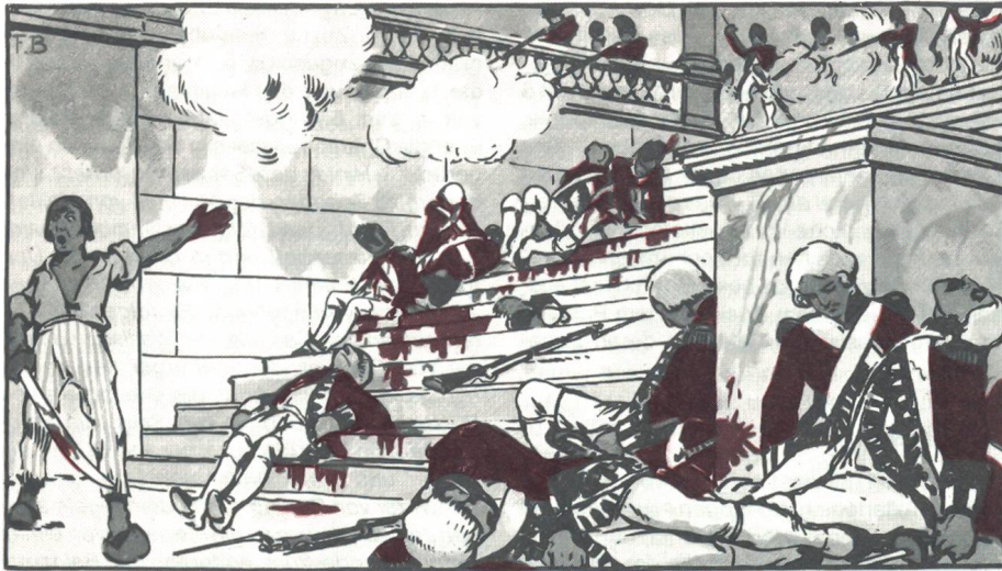
Kampf im Treppenhaus des Tuilerienpalastes. Die letzten Kompanien des am 10. August 1792 gegen Mittag bereits zerschlagenen Garderegiments gehen unter.

Erinnerungspostkarte zum 1. August um 1920