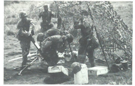
US-Minenwerfer in Aktion.