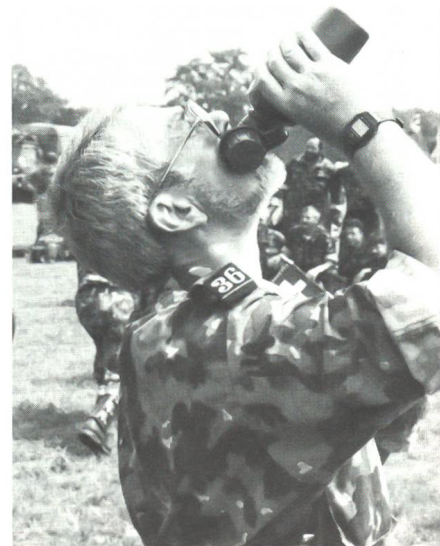
Ein besonderes Problem war dieses Jahr die aussergewöhnliche Hitze.

Freitag, 24. Juli: Tagwache 2.15 Uhr. Abmarsch 4.15 Uhr. Es geht dem Ende zu. Noch ein Marschtag. Aber auch der will zuerst marschiert sein. Bei leichtem Nebel und einem eindrücklichen Sonnenaufgang bewegen wir uns in Richtung Grave. Von da via Gasselbeers nach Cuijk, wo speziell für den Vier-Tage-Marsch eine Pontonbrücke aufgebaut wurde, welche wir auch überqueren. 12.30 Uhr Eintreffen auf dem