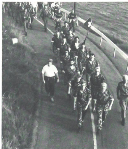
... bei der Maasbrücke in der Nähe von Grave ...

trittsverlesen. Dislozierung ins Camp Heumensoord, wo sämtliche militärischen männlichen Marschteilnehmer aller Nationen einquartiert sind. Einrichten der in diesem Jahr für uns Schweizer zum erstenmal zur Anwendung kommenden Wohnkontainer. Abtreten in den «Urlaub». Die Zeit von Sonntag nach Abtreten bis Montagabend wird sehr individuell genutzt, sei es mit Reisen im Gastgeberland Holland, sei es mit Einkaufsbummel oder anderweitigen Erledigungen.