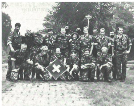
... und am Ziel des Vier-Tage-Marsches.

trittsverlesen. Dislozierung ins Camp Heumensoord, wo sämtliche militärischen männlichen Marschteilnehmer aller Nationen einquartiert sind. Einrichten der in diesem Jahr für uns Schweizer zum erstenmal zur Anwendung kommenden Wohnkontainer. Abtreten in den «Urlaub». Die Zeit von Sonntag nach Abtreten bis Montagabend wird sehr individuell genutzt, sei es mit Reisen im Gastgeberland Holland, sei es mit Einkaufsbummel oder anderweitigen Erledigungen.