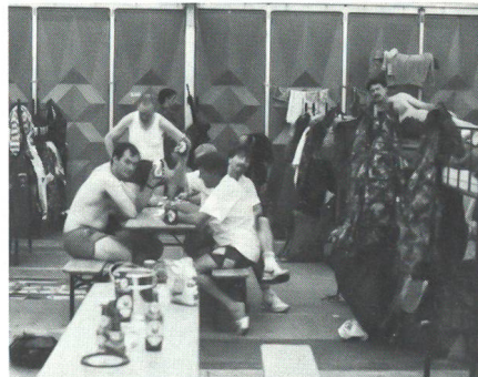
Schluss mit der «Zeitromantik»! Dieses Jahr waren auch die Schweizer in «Wohncontainern» untergebracht.

Den Protokollen des UOV Bern ist zu entnehmen, dass schon seit 1950 an die Bildung einer Wehrsportgruppe gedacht wurde. 1952 dann wurde eine Wehrsportgruppe ins Leben gerufen. Die ersten Jahre waren nicht nur mit Einigkeit gesegnet. Es drohte eine baldige Auflösung. Dank persönlichem Engagement