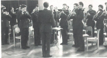
Das Spiel des Inf Rgt 24