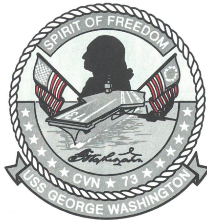
Das offizielle Emblem des Flugzeugträgers «USS George Washington».

Der neueste Flugzeugträger ehrt einen Präsidenten, wie beispielsweise andere bereits im Dienst stehende Schiffe. George Washington,