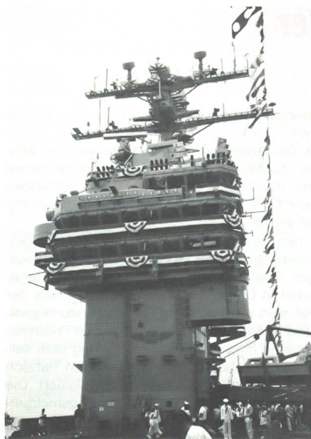
Der Kommandoturm, auch «Insel» genannt, des Flugzeugträgers «USS George Washington» ist seitlich am Flugdeck rechts (steuerbord) platziert. Er umfasst 8 Decks. Das 5. Deck (der sogenannte 07 level, als untere Fensterreihe erkennbar) ist die Admiralsbrücke, das 6. Deck ist die eigentliche Brücke, auch Navigationsdeck genannt, von welchem aus der Kapitän sein Schiff führt. Zuoberst befindet sich der «Kontrollturm», von wo aus der Flugverkehr auf dem Deck geführt wird.