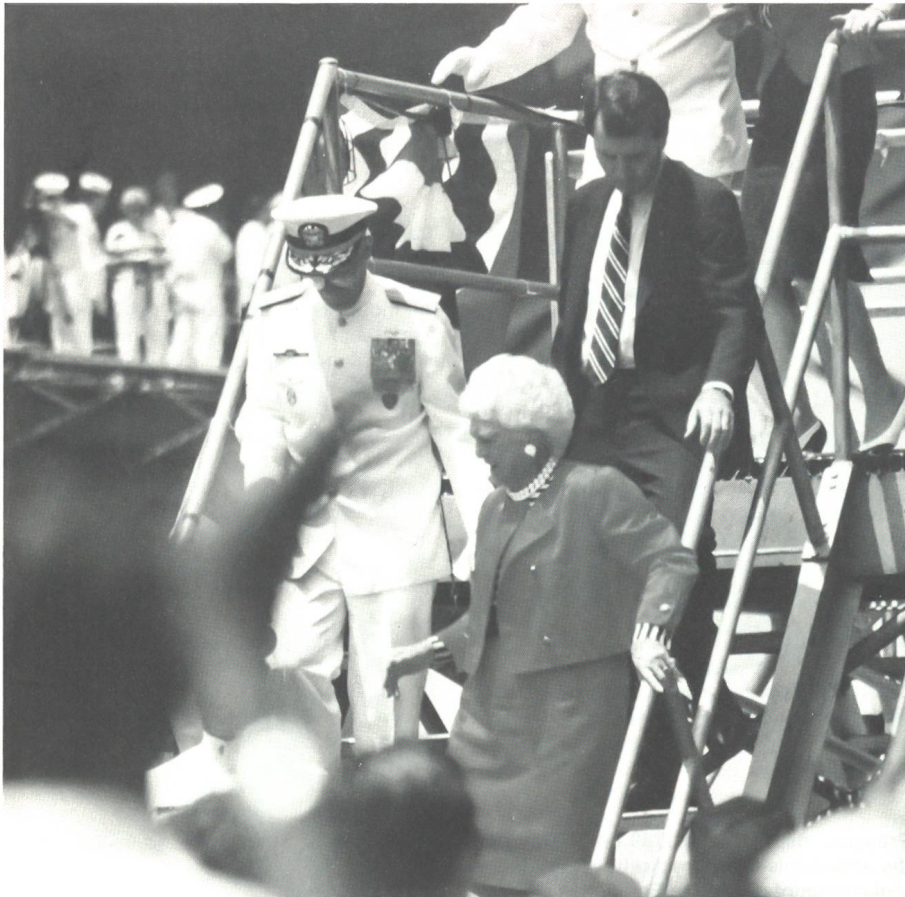
Frau Barbara Bush, die Gattin des US-Präsidenten, verlässt nach der Indienstellungs-Zeremonie in Begleitung eines Admirals den Flugzeugträger.

Flaggen wurden gehisst, die auf dem Pier in weisser Uniform aufgestellte Besatzung eilte im Laufschrift über die Stege an Bord und nahm entlang dem Flugdeck und auf der Insel Paradeaufstellung, im Tiefflug flogen Kampflugzeuge des Marineflieger-Geschwaders 7 über das Schiff. Sie werden in Zukunft die Hauptwaffe dieses neuen Trägers bilden.