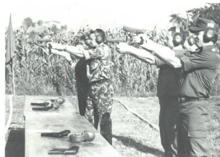
«Sind die Schützen bereit» – «Feuer». Österreicher und Schweizer Seite an Seite beim Pistolenschieszen.

Zielwurf und die bereits erwähnte Übersetzungsübung. In die Steinzeit zurückversetzt sah man sich beim Überraschungsposten. Mit einer grossen Steinschleuder galt es, die Scheibenbilder auf der Burgzinne zu treffen. Dass neben Treffsicherheit auch eine rechte Portion Muskelkraft benötigt wurde, bekamen die Wettkämpfer bereits beim Spannen zu spüren. Besonders Raffinierte entledigten sich dieser Aufgabe im Teamwork. Der Linien-OL, von der Topographie her topfeben, besass im Berechnen der Posten seine Tücken. Die Zeit, diese zu ermitteln, war meist grösser, als den OL abzulaufen. Zudem stellte der kartentechnische Bereich höchste Anforderungen an die Wettkämpfer.