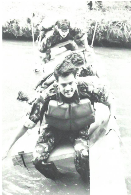
Balancierschwierigkeit einer Schweizer Patrouille.