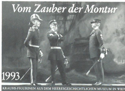
KRAUHS-FIGURINEN AUS DEM HEERESGESCHICHTLICHEN MUSEUM IN WIEN

Das österreichische INFO-TEAM Landesverteidigung hat ein neues militär- und kulturhistorisch interessantes Produkt produziert. Es handelt sich um einen viersprachigen (Deutsch, Englisch, Italienisch, Ungarisch) Monatskalender für das Jahr 1993 im