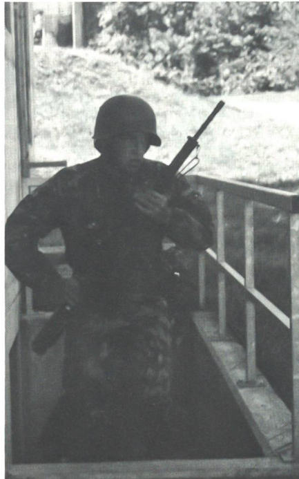
Verbissener Einsatz beim Einzelgefechtsparcours.

ren zum Zielhang. Dort bauten wir die verschiedensten Sachen für die Schiessdemo auf. So zum Beispiel: ein Gestell mit Knochen und einer gefüllten Schweinsblase, eine Autotüre, ein Helm, Dosen mit verschiedenen Materialien gefüllt, einen Strohhallen, Stahlplatten usw. Anhand dieser verschiedenen Ziele sollte die Wirkung der GP 11 gezeigt werden.