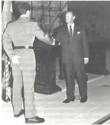
Der Finanz- und Militärdirektor des Standes Solothurn, Regierungsrat Hänggi, befördert einen Aspiranten per Handschlag zum Leutnant der Infanterie.

Der «Schweizer Soldat» berichtete über den Centurion in der Nr 5/85. Aus «Rheintal» Juli 92