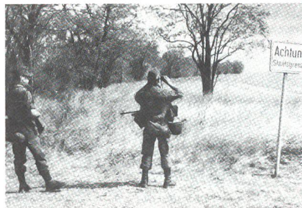
Aus «Soldat» Österreich, Nr 21, Nov 91, gekürzt.

Das Innenministerium ragierte mit seinem Ansuchen auf eine Steigerung der illegalen Grenzübertritte im