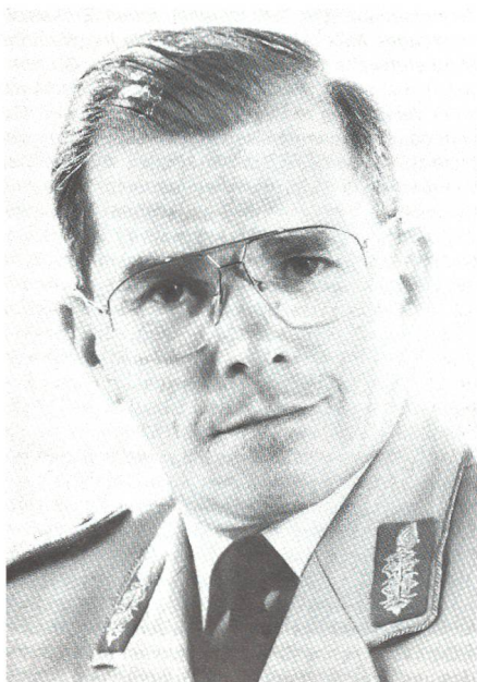
SCHWEIZER SOLDAT 1/92

Naumann war von 1977 bis 1979 Kommandeur des Panzerartilleriebataillons 55 in Homberg/Elze und 1984 bis 1986 Kommandeur der Panzergrenadierbrigade 30 in Ellwangen. In Stabsverwendungen war er u a G3 einer Panzerbrigade, im Bundesministerium der Verteidigung im Führungsstab der Streitkräfte und in der Abteilung Personal. Er war Stabsoffizier beim Stellvertretenden Generalinspekteur und Dezernatsleiter des Deutschen Militärischen Vertreters