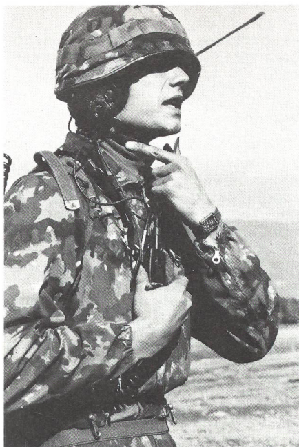
Die Fähigkeit, gestellte Aufgaben unter extremen Bedingungen lösen zu können (Kriegstüchtigkeit, Katastrophentauglichkeit) muss auch nach 1995 oberstes Ziel der militärischen Ausbildung sein. (Bild: Zugstruppunteroffizier der mechanisierten Artillerie beim Einrichten der Batterie).

An erster Stelle zu nennen wäre die Verbesserung der Führung und der Einsatzbedingungen der InstruktorInnen; als Leitsatz muss gelten, dass der Instruktor zwar Berufs-Soldat ist, der Aspekt Beruf aber mindestens ebenso wichtig ist wie der Aspekt Soldat. Die Zeiten, in denen ein Instruktor sein ganzes Leben auf dem Feld, dem Kasernenhof und im Kasino zugebracht hat, gehören längst der Vergangenheit an. Allzuoft sind das aber die Vorstellungsmuster, nach denen InstruktorInnen geführt werden. Das Übel der sogenannten Ausbildung von Lehrlingen durch Lehrlinge löst man am allerwenigsten mit einer Entmündigung des Milizoffiziers und indem man die langweiligen Phasen der Grundausbildung einfach an die