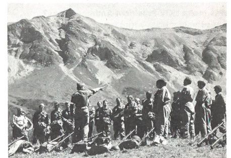
Der UOV Amt Erlach ist eine stolze UOV-Sektion: 1978 an der Kaderübung auf der Chleui-Alp im Diemtigtal ...

Zahlreiche weitere Vereinsaktivitäten sind für dieses Jahr geplant, zum Beispiel Besuch der Rekruten-