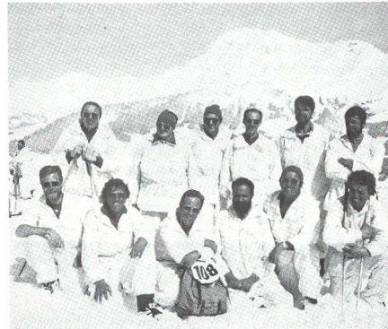
... und 1983 am Zweitage-Skilauf in der Lenk.

lenanlage erneuert, von der 50-m-Distanz auf die 25-m-Distanz umgestellt und mit zehn vollautomatischen Scheiben versehen. Beide Anlagen befinden sich auf dem Gelände der Strafanstalt Witzwil, wo auch eine schöne Schützenstube eingerichtet werden konnte. 1987 feierte die Sektion ihr 50jähriges Bestehen mit einem Jubiläumswettkampf und einem dankwürdigen Fest. Zu diesem Anlass erschienen viele Wettkämpfer aus der ganzen Schweiz und unter den eingeladenen Gästen ausserordentlich viele Prominente.