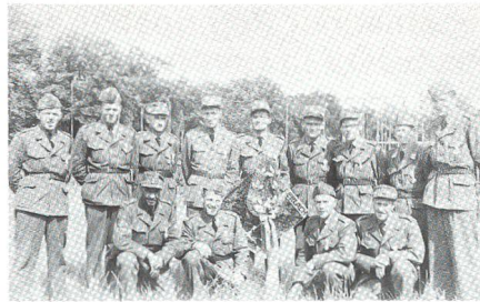
Aus der Vereinsgeschichte: Der UOV Amt Erlach 1961 an den schweizerischen Unteroffizierstagen in Schaffhausen ...