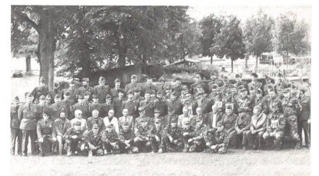
... und 1990 mit über hundert Wettkämpfern an den schweizerischen Unteroffizierstagen in Luzern.