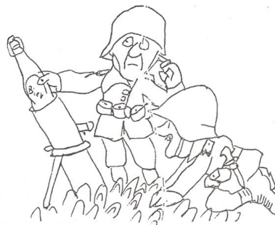
Auch ein Schuss Humor ist in der Jubiläumsschrift zu finden.

rischen Wettkämpfe zu geben. Obschon auch der 2. Seeland-Wettkampf dieses Jahr nochmals von der Sektion Erlach durchgeführt wird, ist für die Zukunft eine turnusgemässe Organisation geplant.