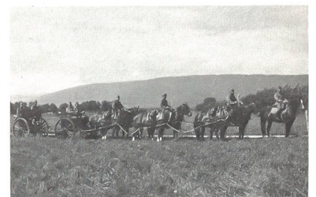
... 1983 am Umzug des Zentscheune-Festes ...