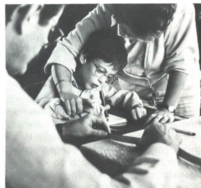
Cerebralgelähmtes Kind wird von den Eltern betreut. Die Stiftung für das cerebral gelähmte Kind setzt sich dafür ein, dass möglichst viele cerebral Behinderte zu Hause im Kreise der Familie betreut werden können.