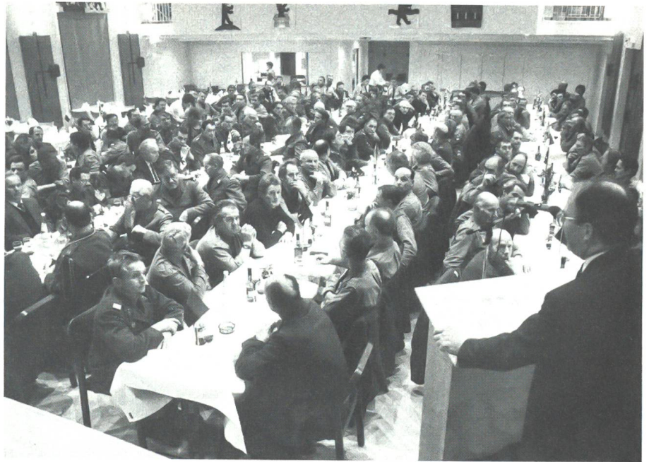
Im Saal des Hotels Linde in Teufen. Der Militärdirektor entbietet den Entlassenen den Dank und die Anerkennung von Volk und Regierung von Appenzell AR.

Zum Schluss gratuliere ich Ihnen allen zum 50. Geburtstag, den Sie in diesem Jahre feiern oder gefeiert haben und verbinde mit meinem nochmaligen Dank meine persönlichen Glückwünsche für die kommenden Festtage, für Ihre Zukunft und die Zukunft Ihrer Familien und Angehörigen. Ich freue mich, Sie im Zivildienst wiederzusehen.