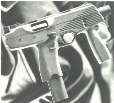
Die futuristisch aussehende TMP-Maschinenpistole. Die 280 mm lange Waffe erscheint 1992 auf dem Markt.

Die Gründung der Steyr-Waffenfabrik geht bis zurück ins Jahr 1864. Am 16. April 1864 gründete der Steyrer Josef Werndl die «Josef und Franz Werndl & Com.», die sich auf die Herstellung von Gewehren spezialisierte. Bekannt wurde die noch junge Firma vor allem durch die Produktion von Hinterladern mit einem Drehkolbenverschluss, damals noch eine sensationelle Neuheit unter den Militärgewehren. Ein Durchbruch gelang schliesslich dem jungen Konstrukteur Ferdinand Mannlicher, der den Geradzugverschluss mit dem Mittelschaftmagazin (ähnlich wie beim