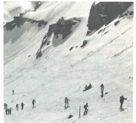
Aufstieg zum Col de la Chaux, 2940 müM.

Jahren günstig und zweckmässig entwickelt. Eine sorgfältige Sicherheitsorganisation fehlt denn auch nicht: vom Funkgerät für jede Patrouille und dem Lawinenverschütteten-Gerät für jeden Patrouilleur, über eine jalonierte und begehrgemachte Wettkampfstrecke mit ständiger Überwachung und Neubeurteilung bis zur ausfindigen Logistik auf allen Gebieten hat man nichts dem Zufall überlassen. Die Rolle der Armee in der PG ist nicht mehr wegzudenken. Ohne sie wäre der Anlass gar nicht durchführbar. Dann spielt die Armee auch einen zweiten Trumpf aus: Die Vereinigung von Zivil und Militär. Freude und Genugtuung sind die Aufhänger dieses Anlasses. Der Geist der PG hat sich zu einem vornehmen Ziel gewandelt: Schweizer und Ausländer, Männer und Frauen, Zivile und Militärs, alle sind zugleich auf demselben Weg, in einer gleichbedeutenden Anstrengung. ☒