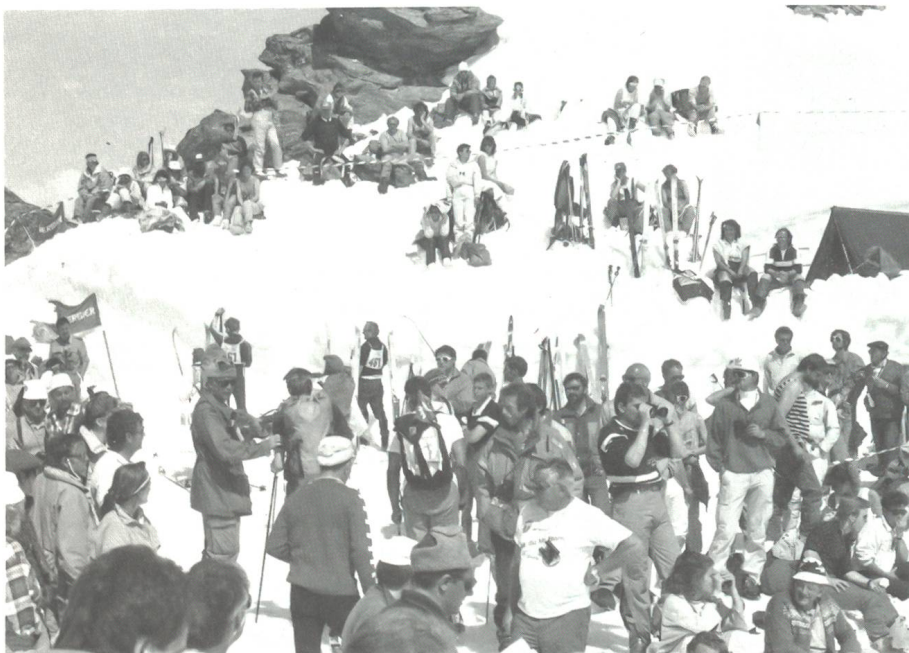
Der gute und fröhliche Konsens von Zivil und Militär.

Die Freude am Erlebnis und der Wille zum Durchhalten zeichnet jeden guten Menschen aus; gut nicht nur im moralischen Sinn, sondern auch rechtlich, im militärischen und politischen Geschehen. Dieser moralisch/rechtliche Sektor ist eine nicht zu vernachlässigende Anstrengung in allen Stufen der Führung. Er schafft das Klima und geht dem tech-