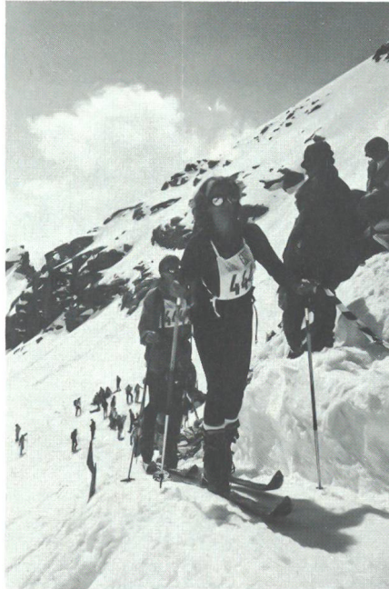
Damen-Zivil-Patrouille im Einsatz.

Die Ausrüstung für die PG ist im Règlement de Course gegeben. Sie hat sich in den letzten