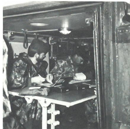
Feuerleitstellenteam bei der Prüfung im Spz (SAT 1990).

Vergleicht man die Teilnehmerzahlen der vergangenen drei Artillerietage, 1980 in Bière, 1984 in Frauenfeld und 1990 in Bern, so ist ein anhaltender Rückgang festzustellen. Trotz einer breiten Disziplinenpalette und dem Bereitstellen von Wettkampfmöglichkeiten auch für ältere Semester macht dieser Rückgang betroffen. Der grosse Materialaufwand und die nötigen Infrastrukturen erforderten zudem praktisch