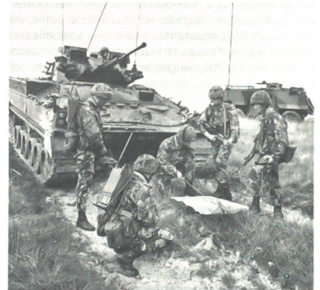
Die Gefechtsfeld-Funkgeräte von Racal: Tornisterfunkgerät JAGUAR-V (oben links), Tornisterfunkgerät JAGUAR-U (unten links), HF-Funkgerät BCC 39 (oben rechts) und das Truppenfunkgerät PRM 4720 (unten rechts). (BN)

Zur Lieferung eines neuen Fernmeldesystems für die kanadischen Streitkräfte ist ein anglo-amerikanisch-