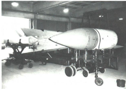
Sowjetische Flugabwehr-Rakete SA-5: Einst sorgsam gehütetes Geheimnis, nun bildet die Bundeswehr daran aus.

Vieles hat sich seit der staatlichen Wiedervereinigung in Badingen geändert – nicht nur die Uniformen wurden gewechselt. Wie in der Ex-DDR üblich, hatte auch beim Bau dieser Raketenstellung Geld keine