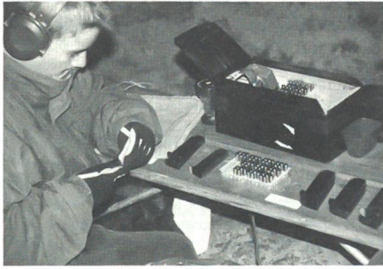
Viele freiwillige Helferinnen und Helfer trugen zum Erfolg des 26. Schaffhauser Nachtpatrouillenlaufes bei.