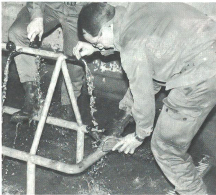
Am Schluss des Laufes: Schuhe putzen...

treuten den Dragon-Posten, und auch das Festungswachtkorps leistete tatkräftige Unterstützung. Wie bei anderen ausserdienstlichen Anlässen ergeben sich auch beim Schaffhauser Nachtpatrouillenlauf immer wieder Probleme im Zusammenhang mit der korrekten militärischen Bekleidung der Wettkämpfer. Die Organisatoren weisen mit Recht darauf hin, dass alle Ausländer in einem einheitlichen, korrekten Anzug erscheinen, und deshalb verlangen sie das auch kompromisslos von den Angehörigen unserer eigenen Armee.