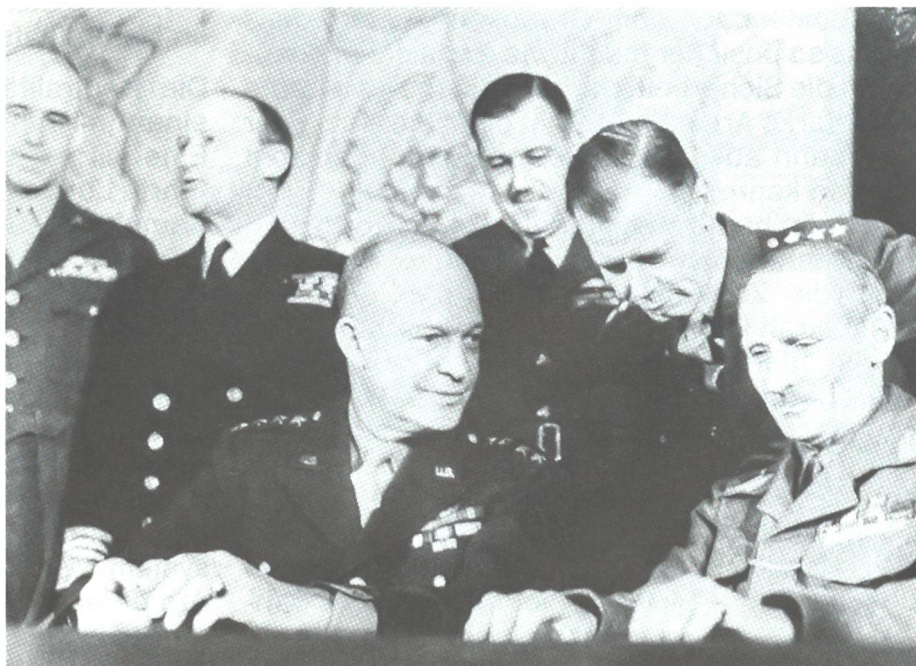
General Eisenhower bei der Planung der Invasion Frankreichs mit (von links nach rechts) General Omar Bradley, Kommandant der 1. US-Armee; Admiral Sir Bertram Ramsay, Oberbefehlshaber der alliierten Seestreitkräfte; Luftmarschall Sir Leigh Mallory, Oberbefehlshaber der alliierten Luftstreitkräfte; Eisenhowers Stabschef General Walter Bedell Smith und Feldmarschall Sir Bernard Montgomery, Kommandant der 21. Heeresgruppe.

Seine Taten unterstützen dieses Paradox. War er am 5. Juni 1944 in der Lage, eine der wichtigsten Entscheidungen (Invasion in Frankreich) während des ganzen Zweiten Weltkrieges zu fällen, konnte er sich am nächsten Morgen nicht entscheiden, welche Uniform er anziehen wolle. Als siegreicher General wurde er zum Kreuzfahrer für den Frieden. Er beendete den Koreakrieg und schuf die Grundlagen für den Krieg in Vietnam. Er nahm eine harte Linie gegen den Kommunismus, wurde aber von Chruschtschow nach dessen Besuch als weich bezeichnet. Er hatte Angst