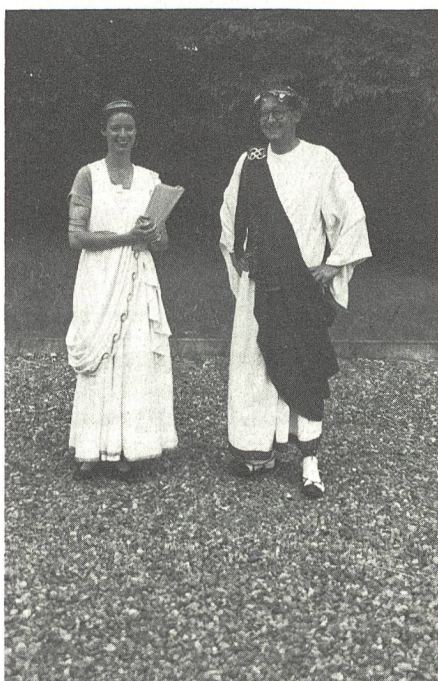
Mit einem «Salve» wurde man da begrüsst