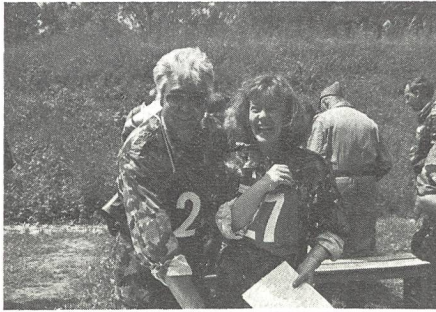
Die Sieger der Disziplin «Kultur»

MFD ganz herzlich für den gelungenen Anlass gratulieren. Ihr habt mit dieser Sommerübung 1993 bewiesen, dass nicht nur Ehrgeiz und eine sportliche Top-Leistung ein Erfolg im Leben sein können, sondern vor allem auch die Kameradschaft und die Freude des Mitmachens, ohne sich zu blamieren. Ich danke Euch vielmals und hoffe auf weitere solche vielseitigen, anspruchsvollen und doch «sauglatten» Übungen.