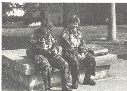
Warten auf was da so kommt...