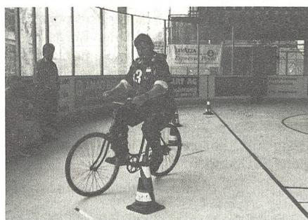
Geschicklichkeitsfahren mit Spezial-Fahrrad

richtigen Antwort und folglich eine grosse geistige Beweglichkeit. Die Fragen 1 bis 9 mussten mittels eines Kassettengerätes gelöst werden, das heisst Fragen wie «Wer singt dieses Lied? Welcher Musikstil könnte das sein?» usw. mussten beantwortet werden. Die Fragen 10 bis 38 überdeckten das Gebiet Militär, Sport, Allgemeinwissen und Scherzfragen. Zum Beispiel «Wo liegt die Heimat des Tilsiterkäses (Toggenburg, Ostpreussen oder Holland)? oder «Wer war der erste Nationalratspräsident (Gantenbein, Schulthess, Ochsenbein)?» oder «Wie hoch war der Steuerfuss der Gemeinde Bülach im Jahr 1992 (89, 105, 127%)?»