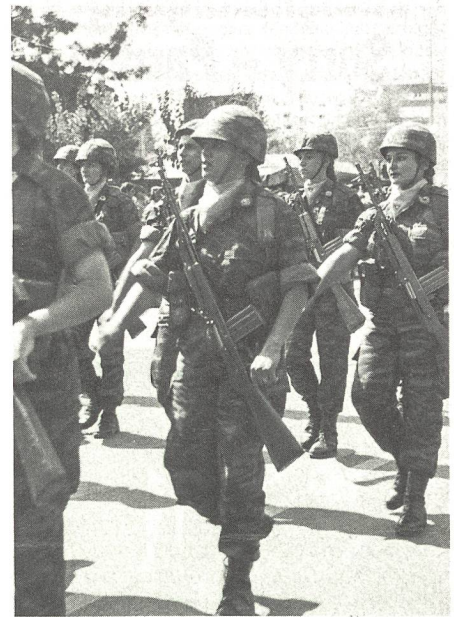
Anlässlich des Nationalfeiertages am 1. Oktober findet eine Militärparade in der Hauptstadt Nikosia statt.

Die Ausbildung der Frauen in der zypriotischen Nationalgarde verläuft etwas anders und viel schneller. Möchte eine junge Zypriotin in die Armee, muss sie nach dem offiziellen