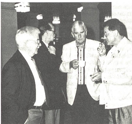
Gespräche bei der Kaffeerunde