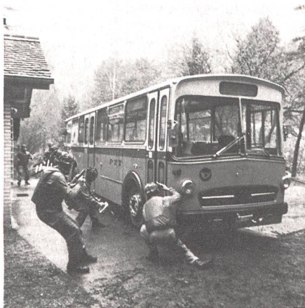
Zugriff anlässlich einer Übung auf einen Bus.

Zum sechstenmal organisierte die deutsche GSG 9 vom 14. bis 18. Juni 1993 einen internationalen Vergleichswettkampf für Spezialeinheiten der Polizei und des Militärs. Der Wettkampf wurde im Hauptquartier der GSG 9 in St. Augustin bei Bonn und auf diversen militärischen Anlagen der NATO durchgeführt. Neben den bedeutenden europäischen Mannschaften (GEK, Österreich/GIS, Italien/RAID, Frankreich/GEO, Spanien) beteiligten sich Teams von USA (Delta Force und Seal Team Six US Navy Special Command) und der Royal Hongkong Police am Wettkampf. Insgesamt nahmen 39 Teams aus 13 Nationen teil. Somit waren leistungsstarke Mannschaften anwesend, die alle als «Profi-Teams» bezeichnet werden können.