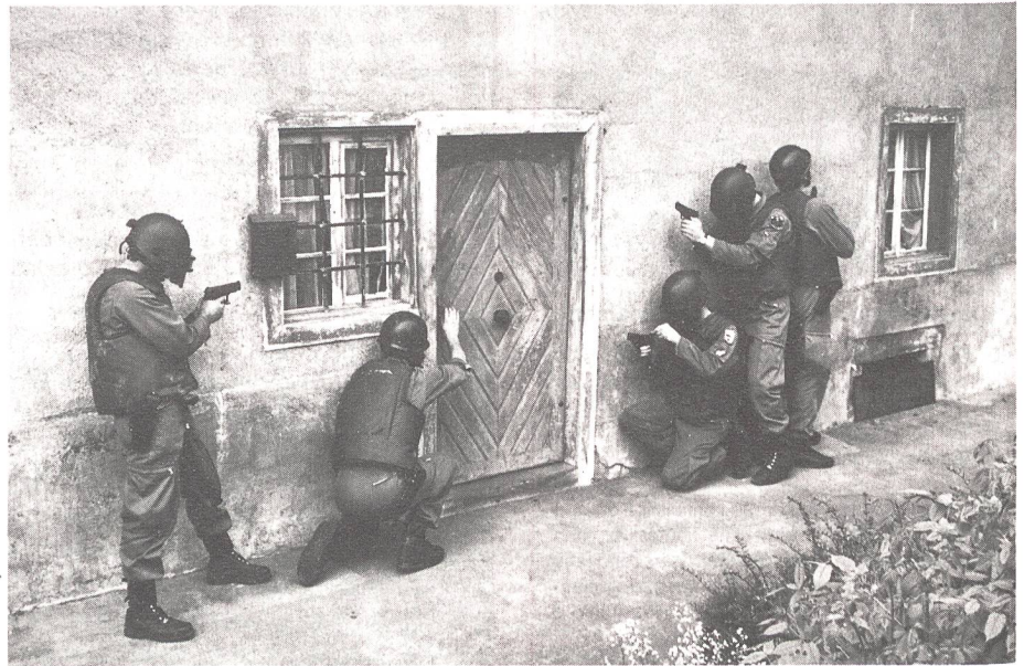
Zugriff anlässlich einer Übung in ein Gebäude.

Ein Blick auf die Festnahmetaktik guter Spezialeinsatzkommandos der Polizei verschiedener Länder zeigt, dass eine konzentrierte und zweckgebundene Combatschiess- und Taktik Ausbildung dazu geführt hat, dass viel weniger geschossen wird. Die gut trainierten Beamten der Sondereinheiten besitzen jenes «Mehr» an Selbstvertrauen, Wissen, Kondi-